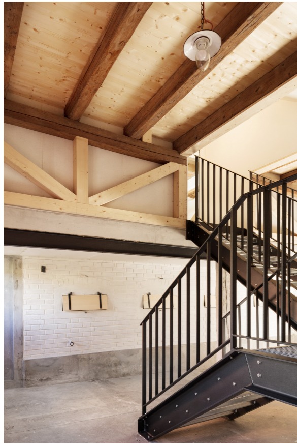
Tenne mit Zugang zu Wohnung