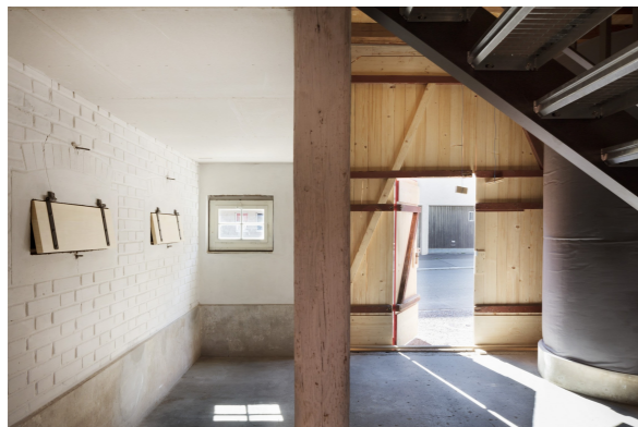
Tenne mit Futternischen

Aufgabe Einbau von zwei Wohnungen in die geschützte Scheune, Erstellen von Schutzplänen für die Denkmalpflege, Neugestaltung der Aussenräume